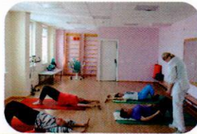
AMBULATORINIŲ PASLAUGŲ PLĖTRA