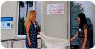
PSIHIKOS DIENOS STACIONARAS ĮKŪRIMAS