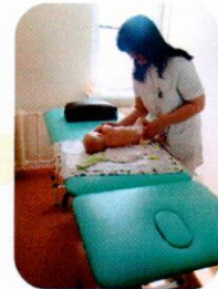
IR PALIATYVIOSIOS PAGALBOS LOVŲ ĮSTEIGIMAS